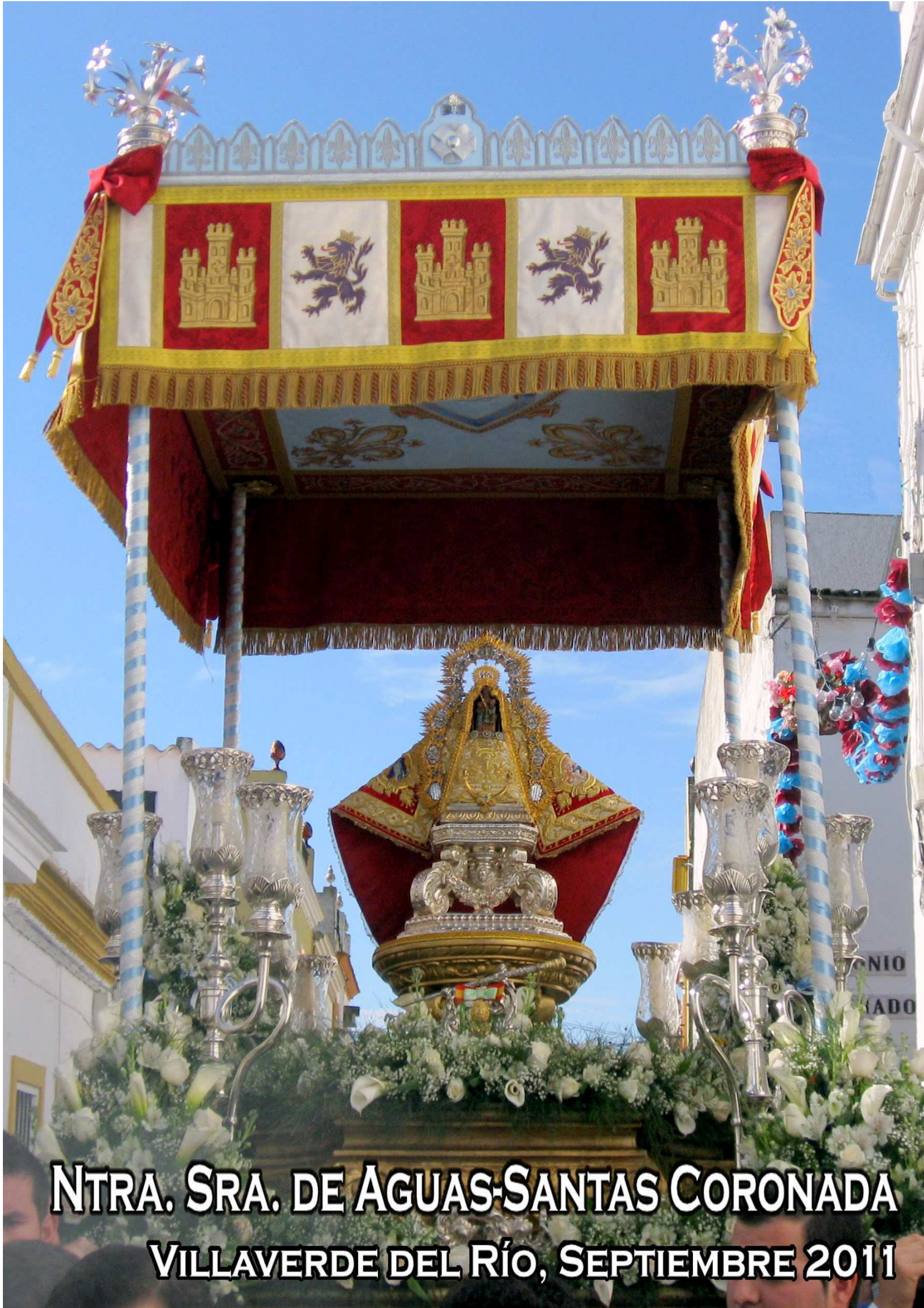
NTRA. SRA. DE AGUAS-SANTAS CORONADA VILLAYERDE DEL RÍO, SEPTIEMBRE 2011