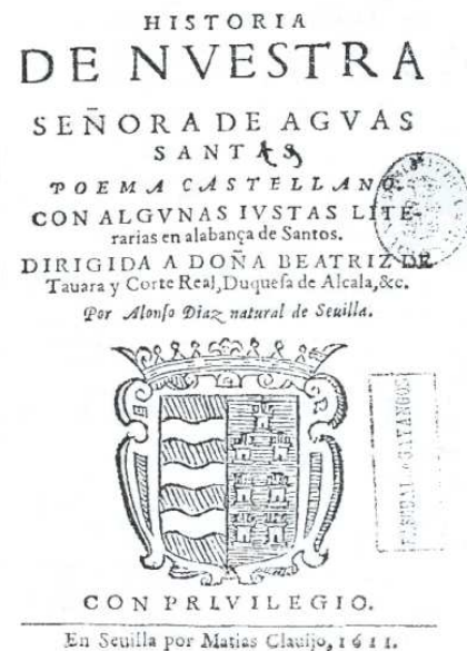
PORTADA ORIGINAL DEL LIBRO