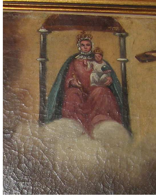
La Virgen de Aguas Santas en un grabado de 1723 y en un exvoto de 1855