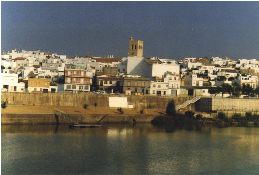
El Guadalquivir a su paso por Alcalá del Río.