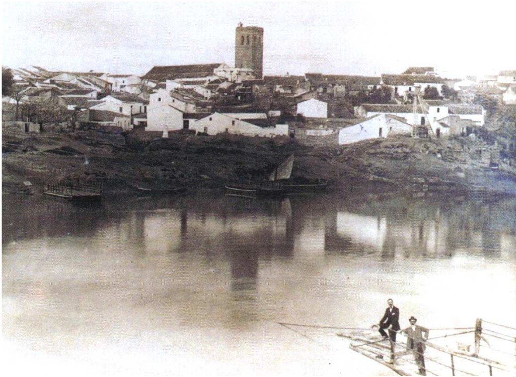
Vista antigua de Alcalá del Río con sus barcas-puente y sus barcas de pesca.