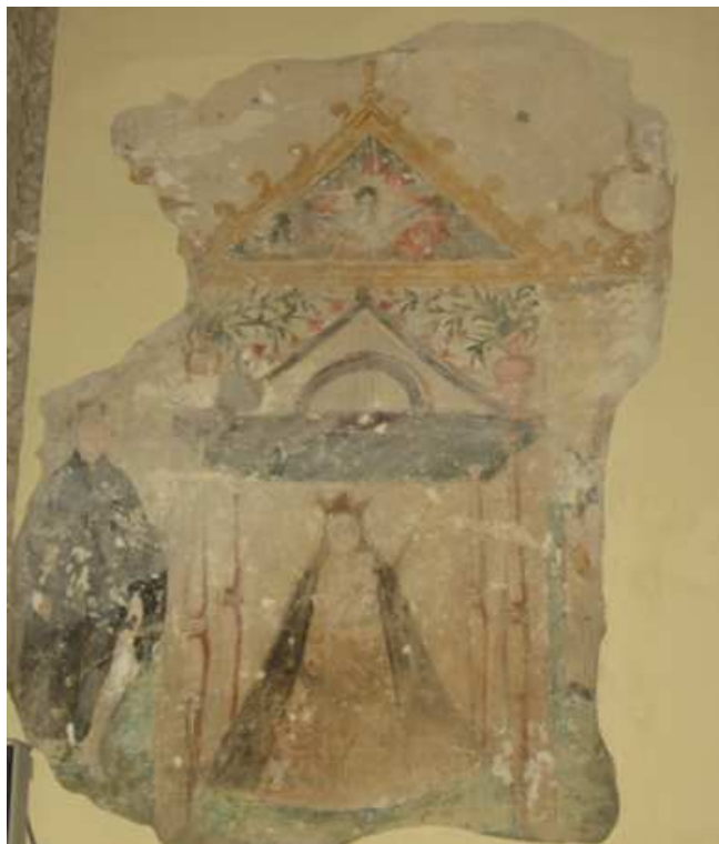
Pintura mural de la iglesia parroquial de la Asunción de Alcalá del Río.

Después de leer el excelente artículo de Julio Velasco Muñoz aparecido en la revista de las fiestas patronales de 2006 9 , que sitúa la ejecución de la pintura en el siglo XVI y no identifica la imagen con ninguna advocación mariana alcalareña conocida, y teniendo en cuenta todo lo dicho sobre la antigüedad de esta devoción en la villa y la histórica vinculación de la propia imagen con Alcalá del Río, ¿no podría tratarse de la Virgen de Aguas Santas?