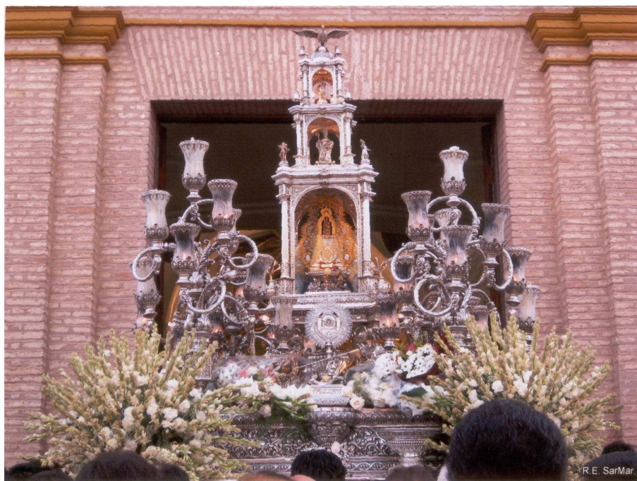
Hermandad de Ntra Sra de Aguas Santas