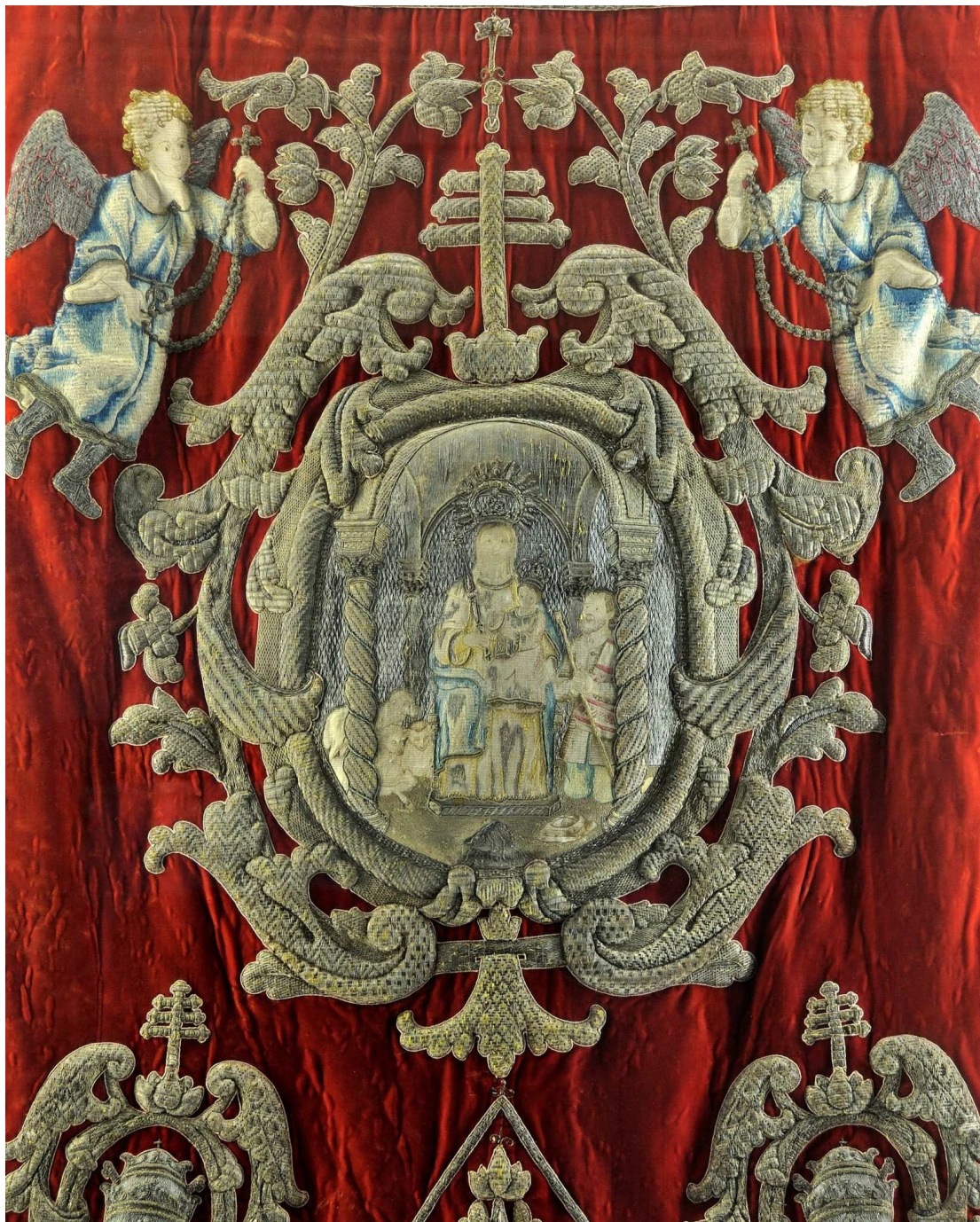
Simpecado de Nuestra Señora de Aguas Santas (1716)