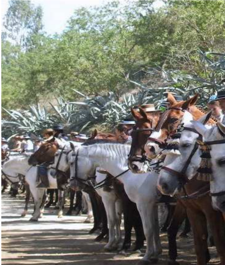
Los caballistas esperan, en formación, la llegada del Simpecado