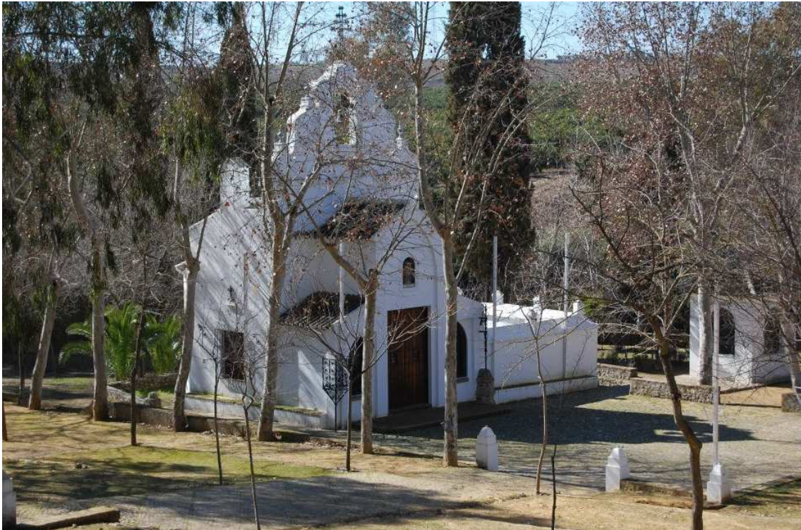
Ermita de Ntra. Sra. De Aguas Santas