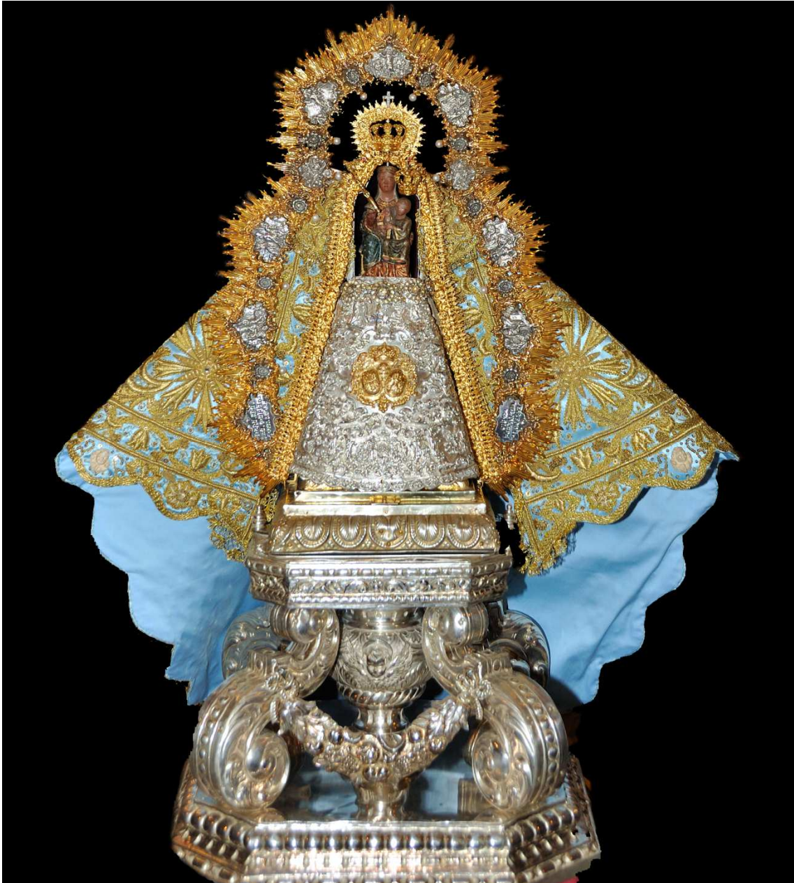
Virgen de Aguas Santas como se muestra a los fieles al culto