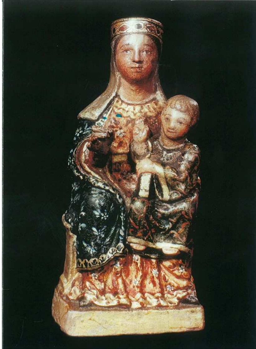
Nuestra Señora de Aguas Santas