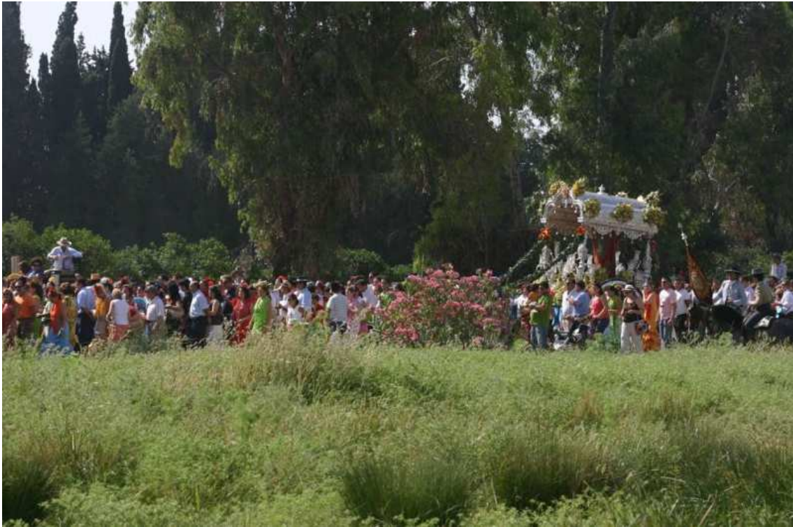
La belleza del camino del Tamujal