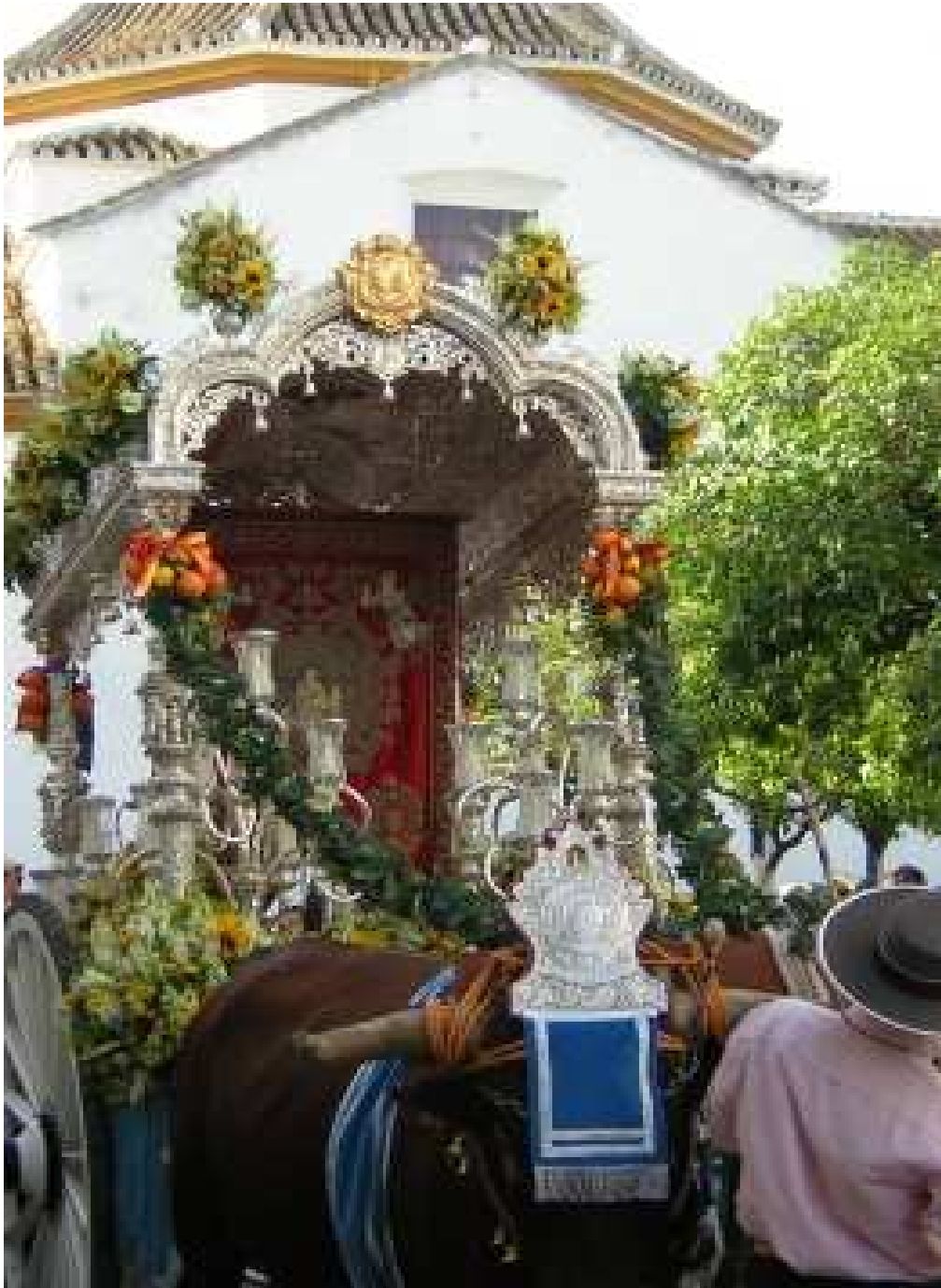
La Carreta enfila la calle Polvillo