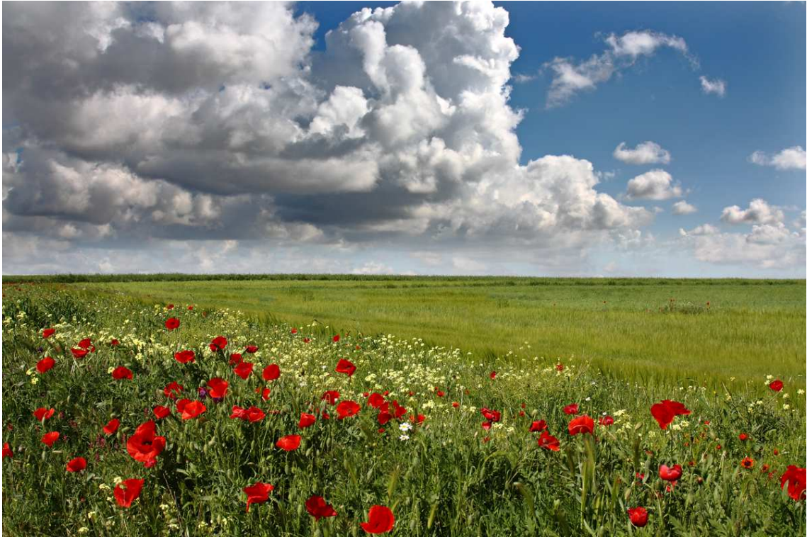
El campo en mayo