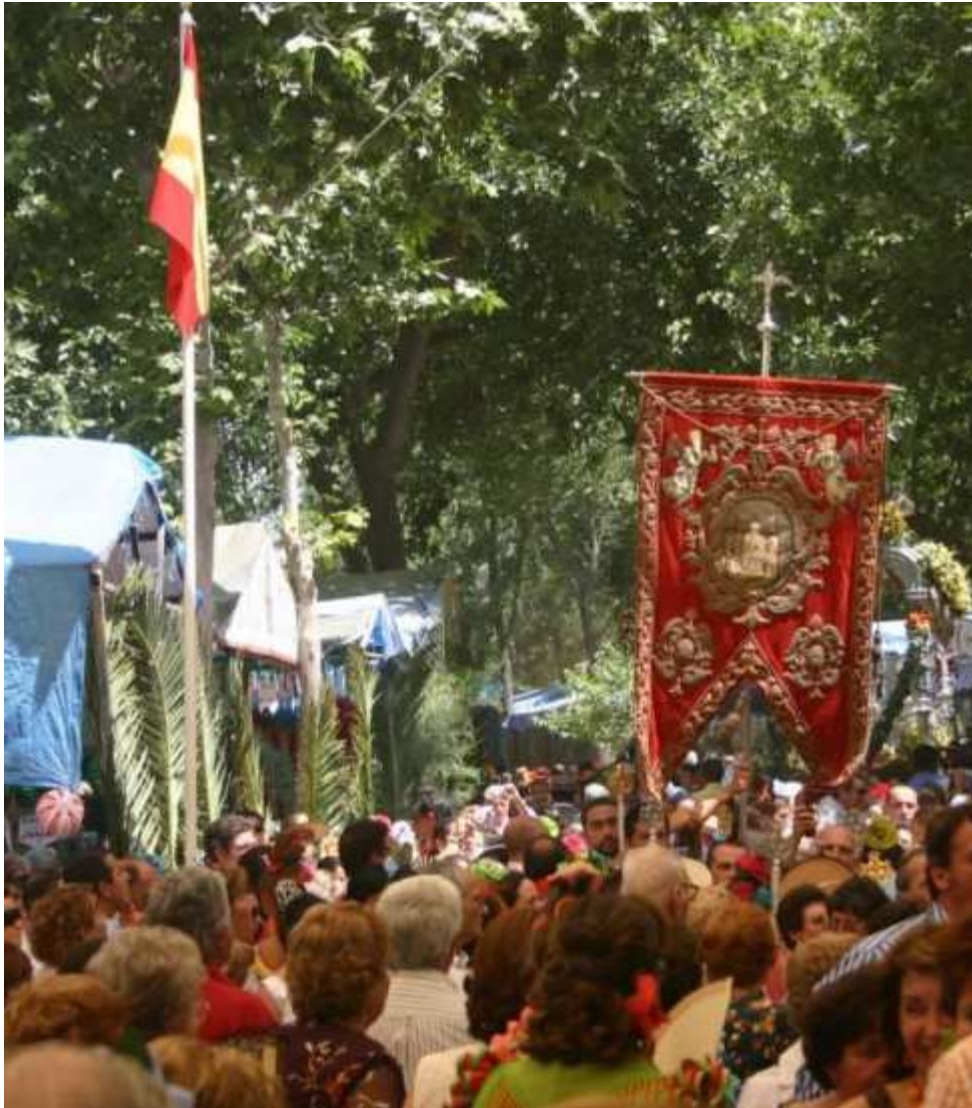
Bajada del Simpecado para celebrar la misa