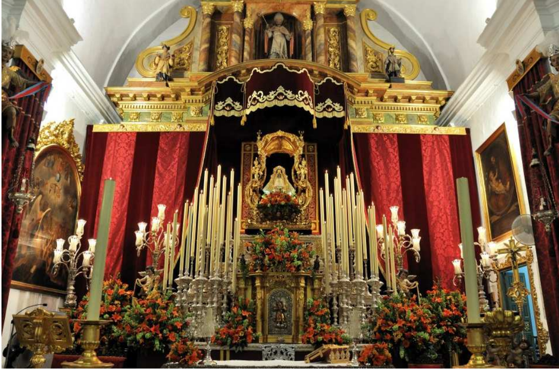
Altar mayor el día 8 de septiembre