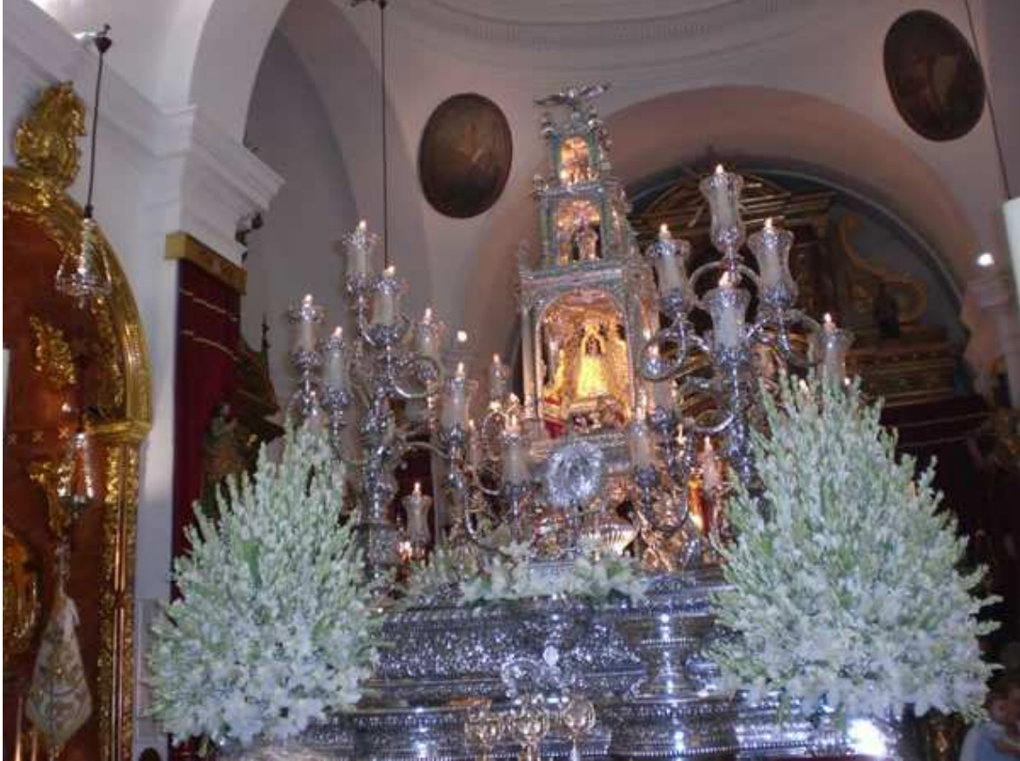
Paso de la Virgen de Aguas Santas. Día 8 de septiembre