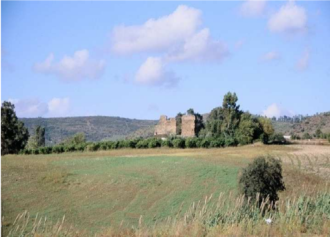
Paredones del Convento Franciscano de Aguas Santas (1602-1835)