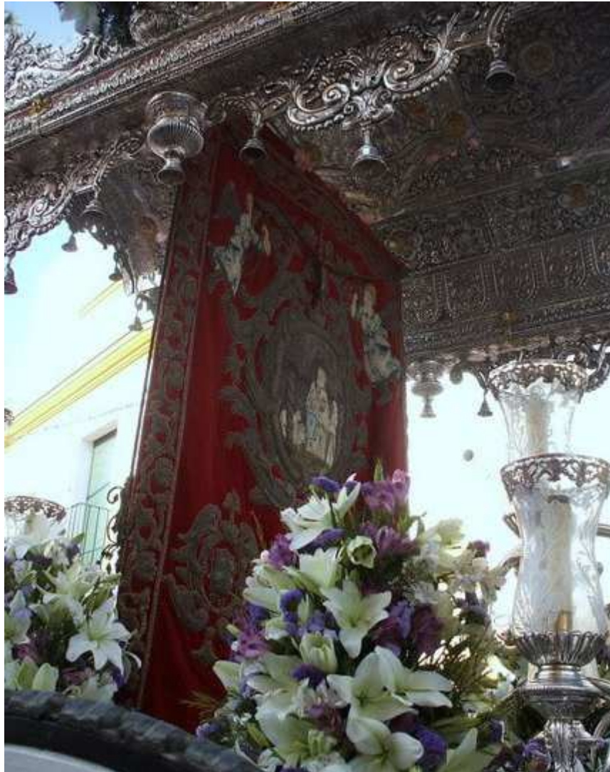
Detalle de la Carreta con el Simpecado